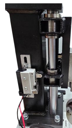
Robuster Aufbau der Stanzführung und der Maschine für eine saubere und kraftvolle Stanzleistung.