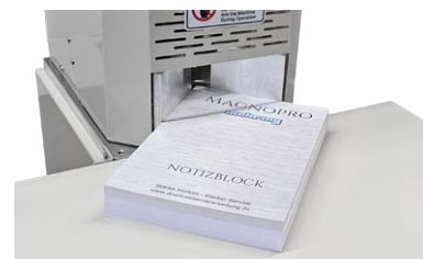
Großer Arbeitstisch für leichtes und sicheres Arbeiten.