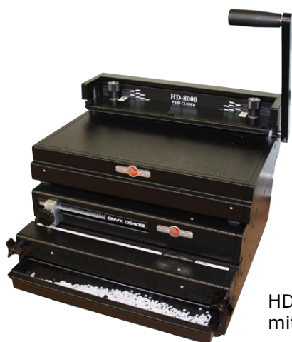
HD 8000 mit OD 4012