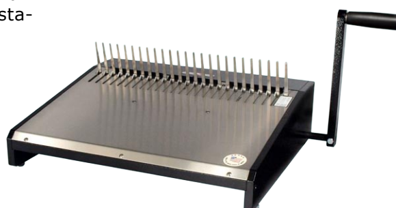
ONYX HD 4470 Plastikringöffner und Schließ- gerät US-Teilung, 21 Ringe bis 50 mm (2") Buchdicke

Die Schließgeräte HD 8000 und HD 8370 können mit verschiedenen Rhin-O-Tuff Stanzgeräten zur Bindestation kombiniert werden.