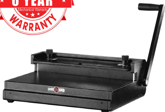
ONYX HD 8000 bis 356 mm Breite, perfekt für Kalender im DIN A3 Querformat