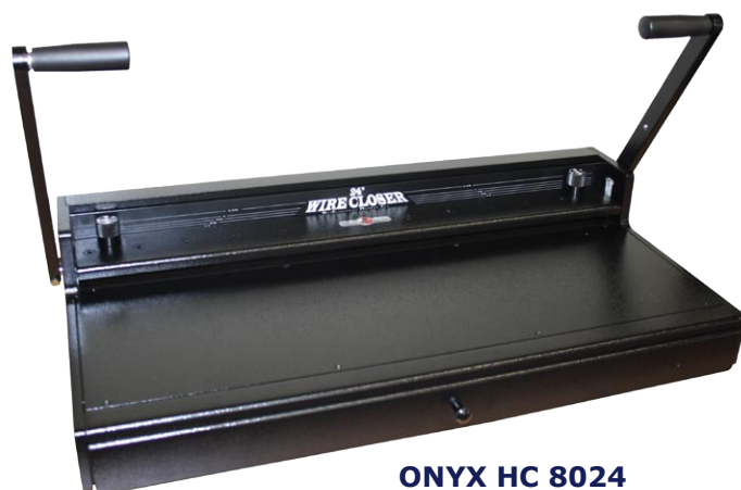
ONYX HC 8024 bis 610 mm Breite, Ausziehtisch für Großformate