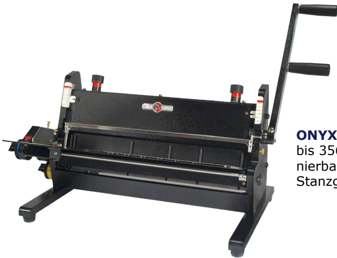
ONYX HD 8370 bis 356 mm Breite, kombinierbar mit verschiedenen Stanzgeräten

Drahtkamm- und Plastikringschließgeräte von Rhin-O-Tuff für effizientes Arbeiten