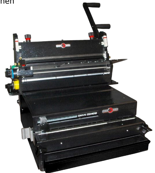
Kombiniertes Stanz- und Bindegerät OD 4012 und HD 8370