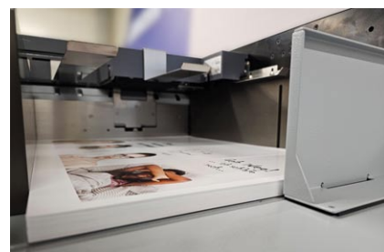
Flachstapelanleger mit Sauglufteinzug