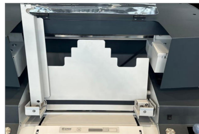
Neues Sesame-System für besseren Zugriff auf den Buchblock

Produktinformationen Stand: Juni 2024, Änderungen vorbehalten.