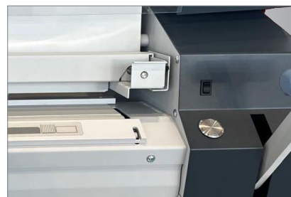
Konstante Qualität: nur auf den Knopf drücken.