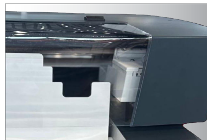
Sichere und robuste Konstruktion mit Schutzschild und ohne Verletzungsgefahr