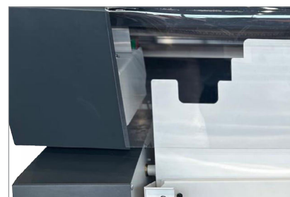
PGO Gen 5 Aufrauher: Rückenvorbereitung für schwierige Papiere